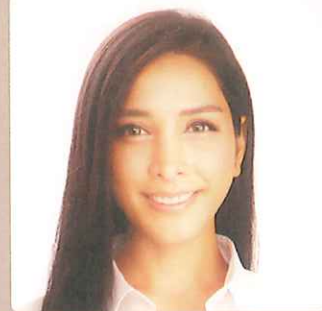
司会 サヘル・ローズ 女優 養子の当事者

赤ちゃんを預かる里親や里親家庭で育ち大人になった当事者の映像を通して里親の役割について伝えます。また、里親が増えている静岡市や福岡市の実践を紹介。後半は、イギリスで生まれた注目の里親研修『フォスターリングチェンジ・プログラム』についてスキットを交えて楽しく解説します。